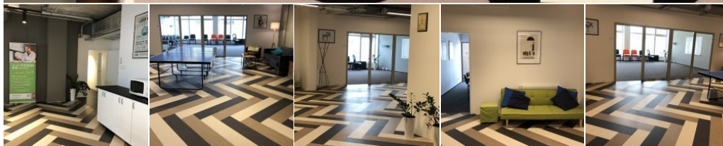
Paragona - kampus za edukaciju liječnika